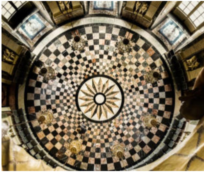
Marmorboden im Kuppelsaal, Schloss Benrath