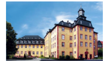
Schlosshotel Geldern

Hinweis: Programm der Stiftung Schloss und Park Benrath auf www.schloss-benrath.de , Anmeldung für Newsletter möglich