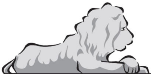
Freunde Schloss und Park Benrath e.V.

Freunde Schloss und Park Benrath e.V. IBAN: DE63 3005 0110 0022 0588 20 bei der Stadtparkasse Düsseldorf